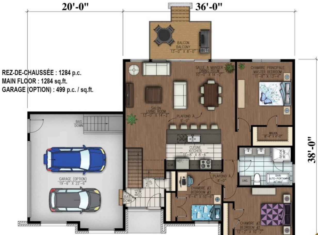
# 826 - Le Sérapis