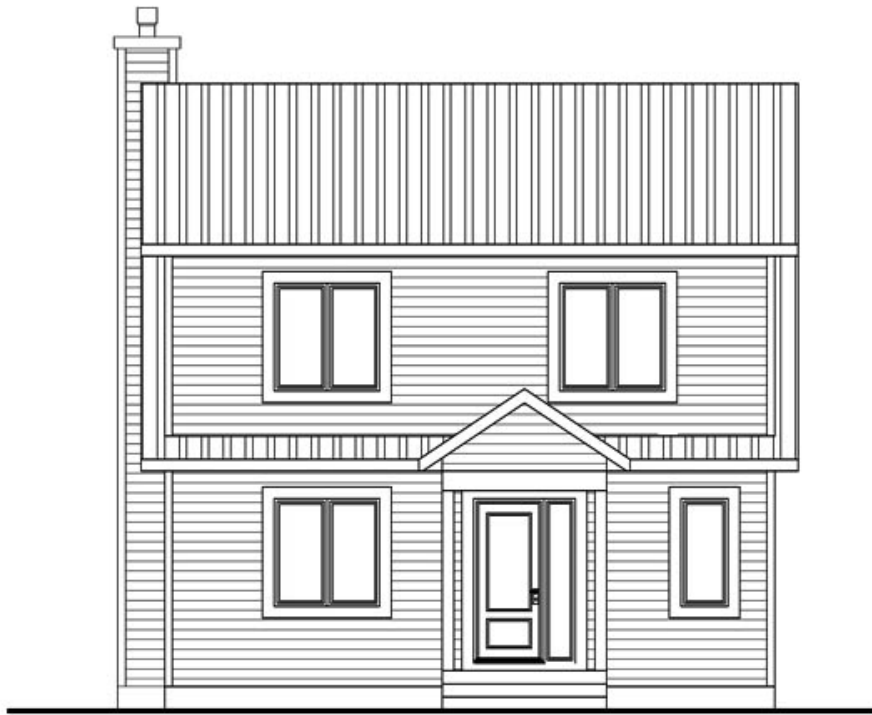
Façade (Côté Rue)