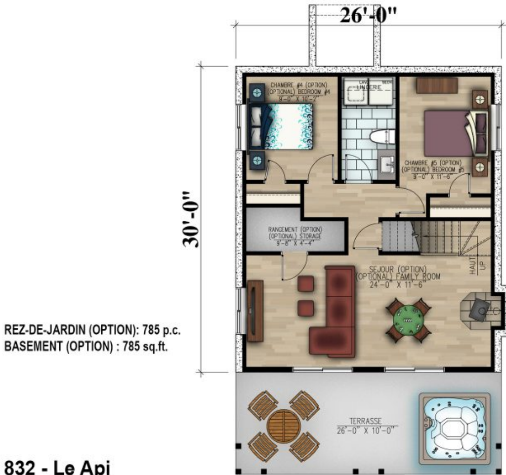
# 832 - Le Api