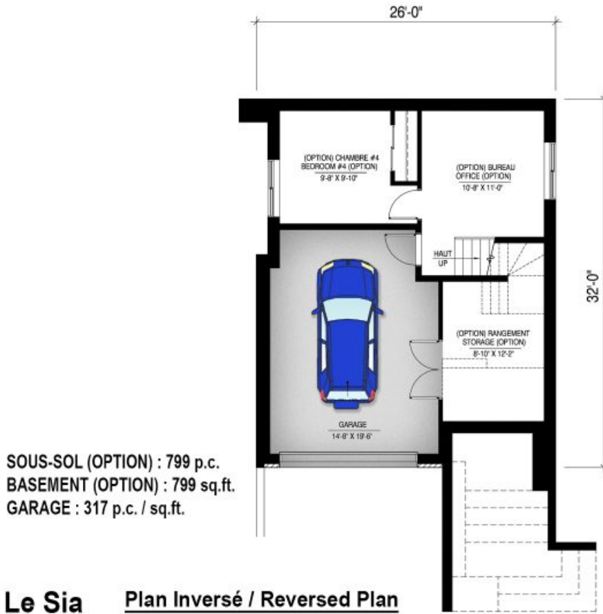
# 840 - Le Sia Plan Inversé / Reversed Plan