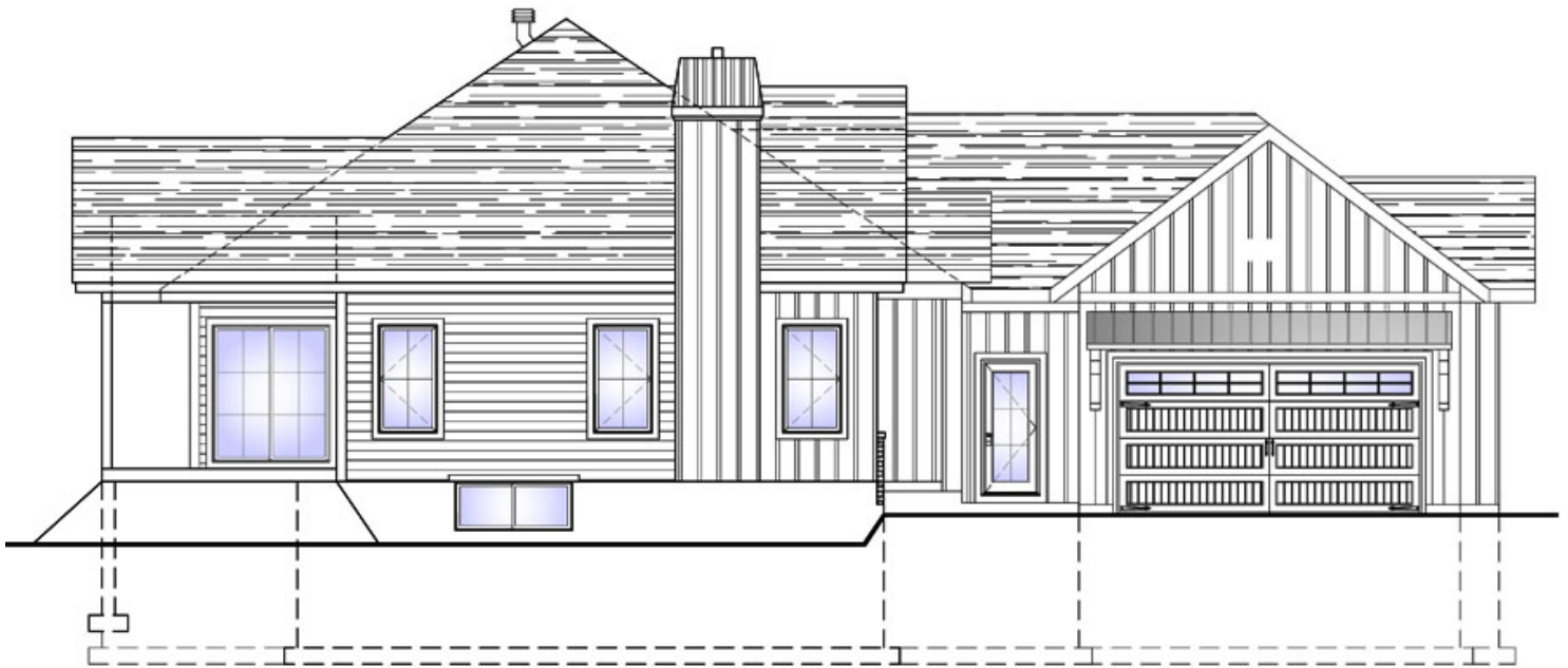
ÉLÉVATION DE LA GAUCHE