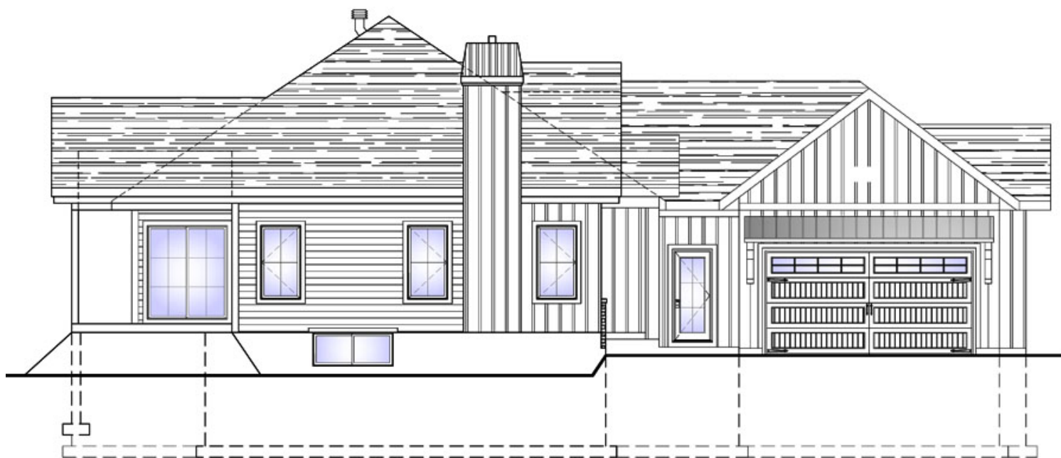
ÉLEVATION DE LA GAUCHE