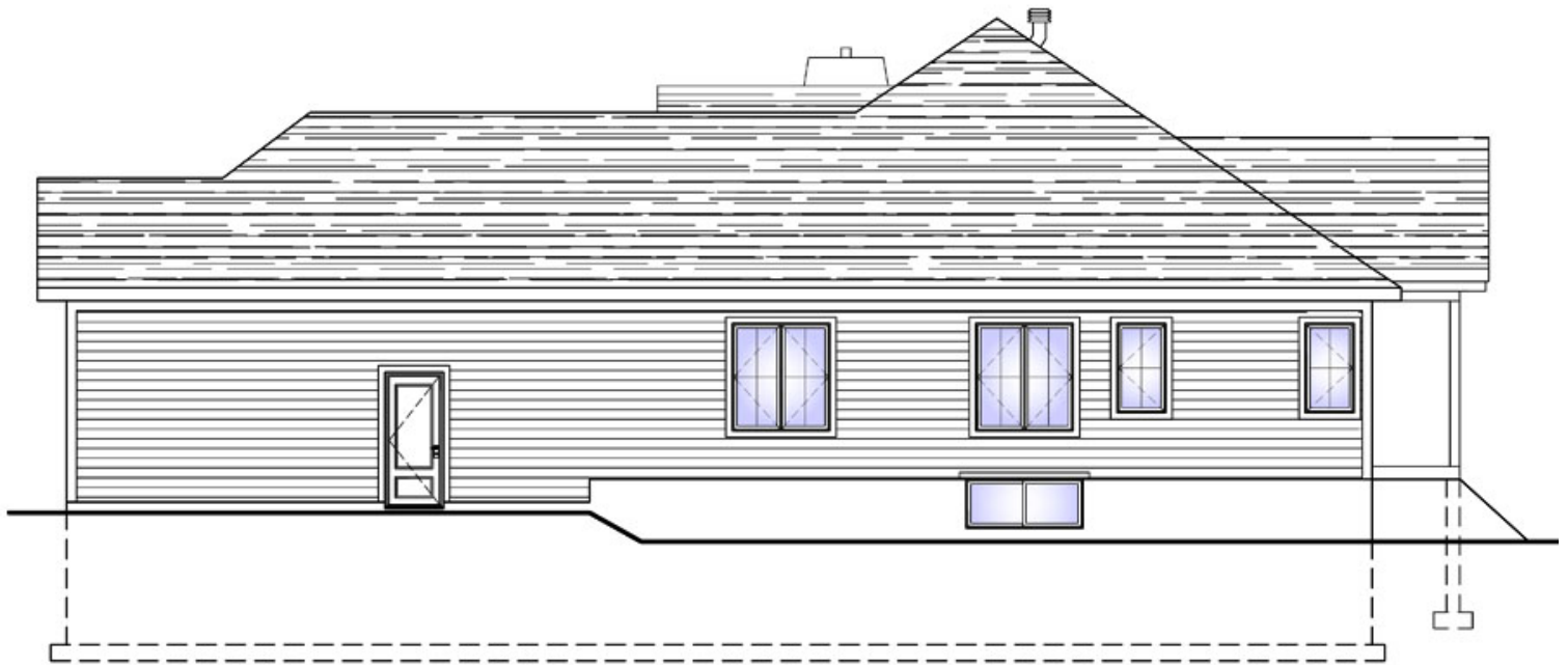
ÉLEVATION DE LA DROITE